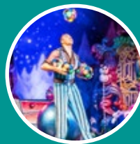
EMPRENDIMIENTOS Y PROYECTOS CULTURALES