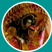
PATRIMONIO CULTURAL Y ARTES

El Historiador y Gestor Cultural es un profesional versátil que puede desempeñarse en: